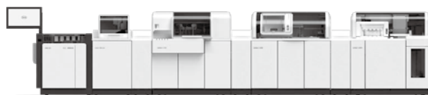
販売名:コバス pro 製造販売届出番号:13B1X00201000081

コバス proに生化学分析ユニット「コバス c 703」と電解質分析ユニット「コバス ISE neo」が加わり、多検体高速処理の実現により大規模検査室にまで対応。20種類以上の連結パターンから検査現場のニーズに合わせて最適なものを選択でき、標準化された試薬・消耗品により、変化に強い持続可能な検査の実現を目指します。検査技師の皆さまへの負担が増していく中で、より臨床に近い仕事に集中できる、次世代の生化学・免疫統合型分析装置が、いま、あなたの検査室へ。