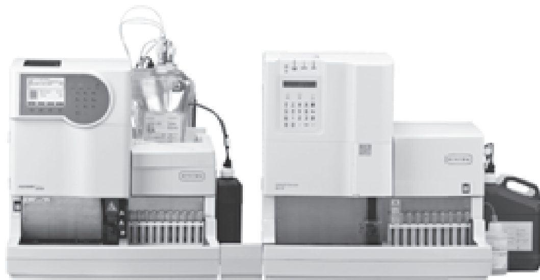
※写真は、HA-8180Vの外観です。 ※最も近いものは株式会社アークレイの製品です。

近年の国際化の進展に伴い、日本国内での変異Hb検出頻度が増加しています。アークレイは、変異Hbを検出することで、より正確な検査を提供いたします。