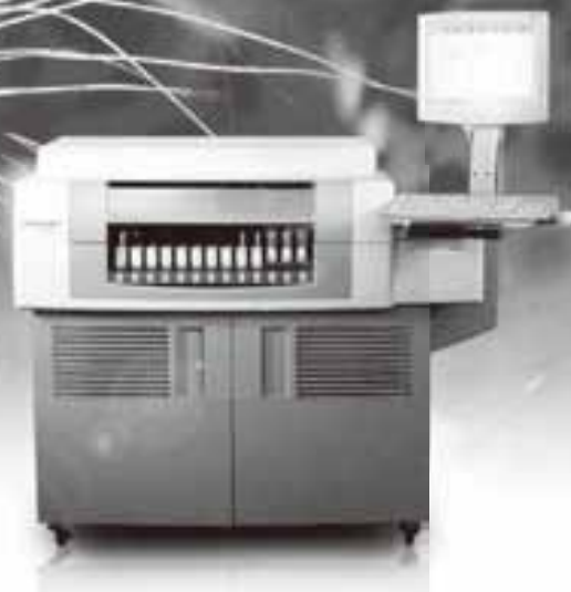
ARCHITECT® アナライザー i1000SR

販売名:セルダインルビー® 医療機器製造販売届出番号 12B1X00001000006