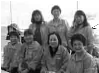
Breast cancer Network Japan -あけぼの会-の方々も駆けつ けてくれました