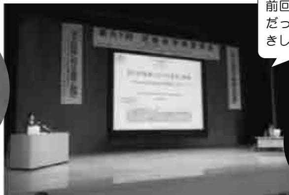
前回の滋賀学会で大好評 だったので、今回もお招 きしやいました。