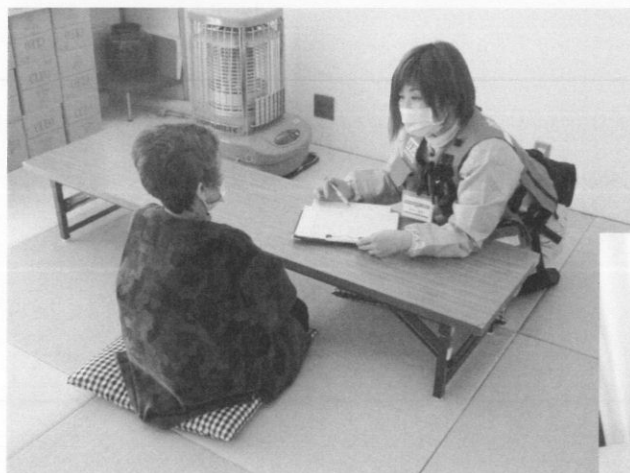
Nsによるカウンセリング風景