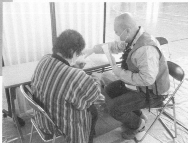
体育館でのDr 診察風景