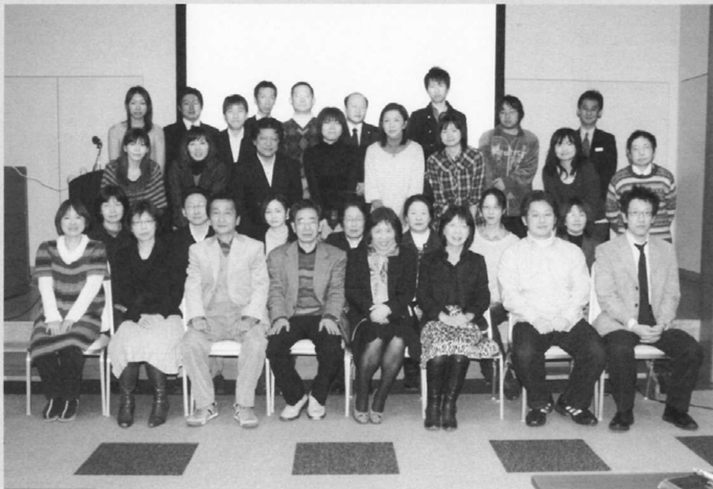
終了後に押田先生を囲んで

また、滋賀の輸血検査に携わってこられたOB技師の方々もこの会に駆けつけて下さり、お話を色々伺うことが出来たので、現在当然のように行っている業務が当時のご苦労のうえにあることを知り、私達も今後何かを伝えられればと思いました。