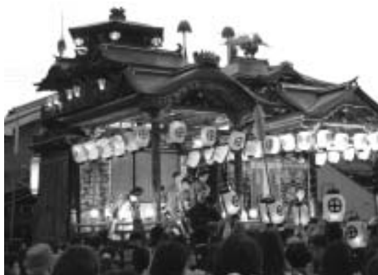
長浜曳山祭り（平成20年4月15日）